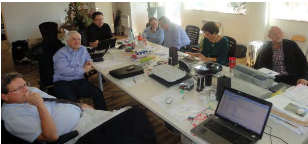
Párizsban ülésezett az EGB

Fentiekhez kapcsolódóan az EGB-nek igen perspektivikus további programjai is megfogalmazódtak és nagyon bízunk abban, hogy jórészt meg is valósulnak. A párizsi egyeztetés alapján ugyanis a 2015. évi Nemzetközi Konferenciánk előtti napokban, 2015. április 18-án tervezi tartani Budapesten a következő munkacsoport megbeszélését a CEN szabványfejlesztő team, majd ugyanitt 19-én lesz a soron következő EGB ülés Budapesten. (Mindkét nap angol nyelvű kommunikációval zajlik.) A tervezett időpontokat az EGB-s kollégák október folyamán fogják véglegesíteni. A MÉT számára ez egy igen előnyös programsorozat lenne, hiszen a 2015. évi tavaszi rendezvényünk vonzerejét jelentős mértékben tudná erősíteni. Tagjainkat változatlanul biztatjuk arra, hogy keressék a bekapcsolódási pontokat a folyamatosan zajló nemzetközi eseményekhez.