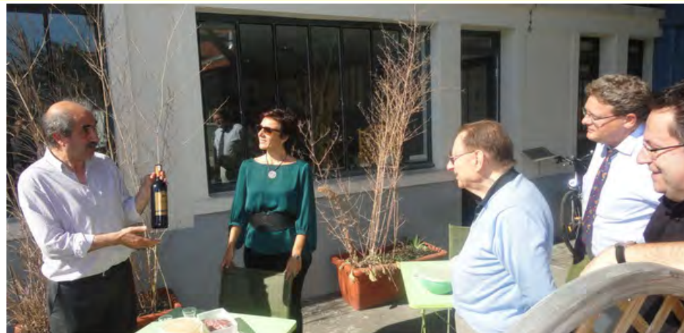
Értékelemzéssel fejlesztett francia bor bemutatója